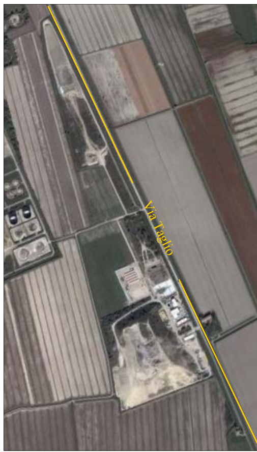
Foto satellitare dell'impianto

Data la minor distanza e la posizione sopravento (NE-SW), la discarica consorziale, impropriamente viene denominata "di Lugugnana".